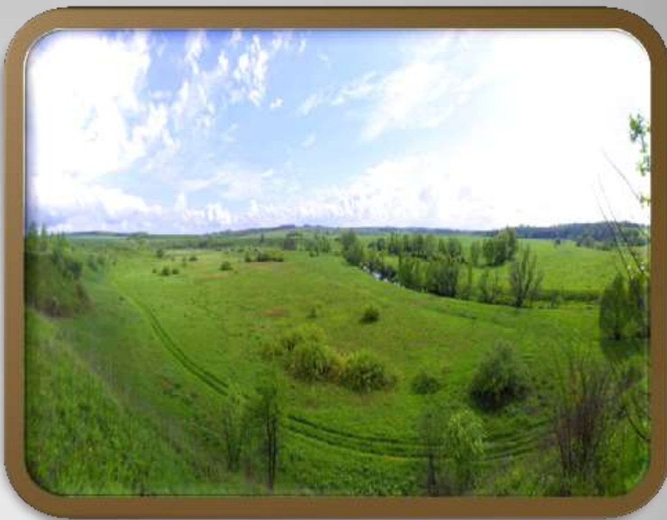
Бежин луг, Тульская область

Одно из самых популярных произведений И.С. Тургенева - «Бежин луг». Написано оно в 1851 году. В произведении повествуется о жизни крестьянских мальчишек. Автор внимательно их слушал и пересказал былички ребят.