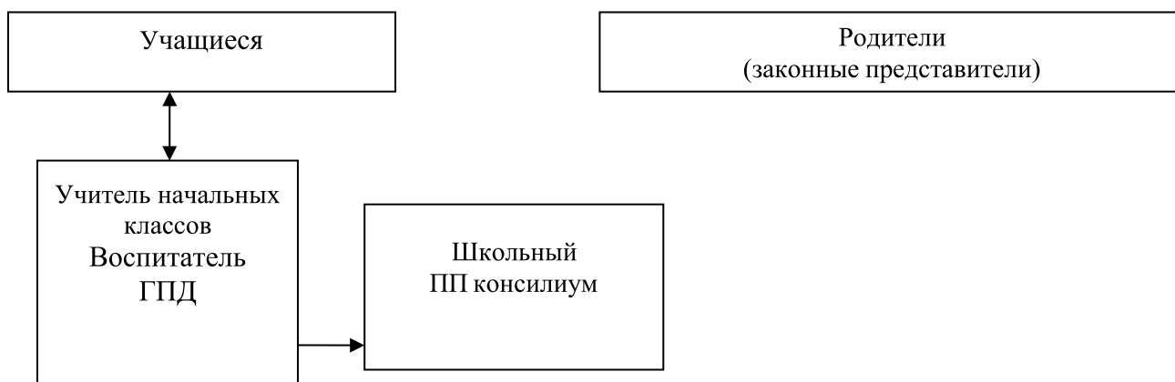
Рисунок 1. Модель взаимодействия педагогов и специалистов

Особое место в модели взаимодействия педагогов и специалистов общеобразовательного учреждения занимают родители (законные представители) учащихся с умственной отсталостью (интеллектуальными нарушениями) в решении вопросов их развития, социализации, здоровьесбережения, социальной адаптации и интеграции в общество.